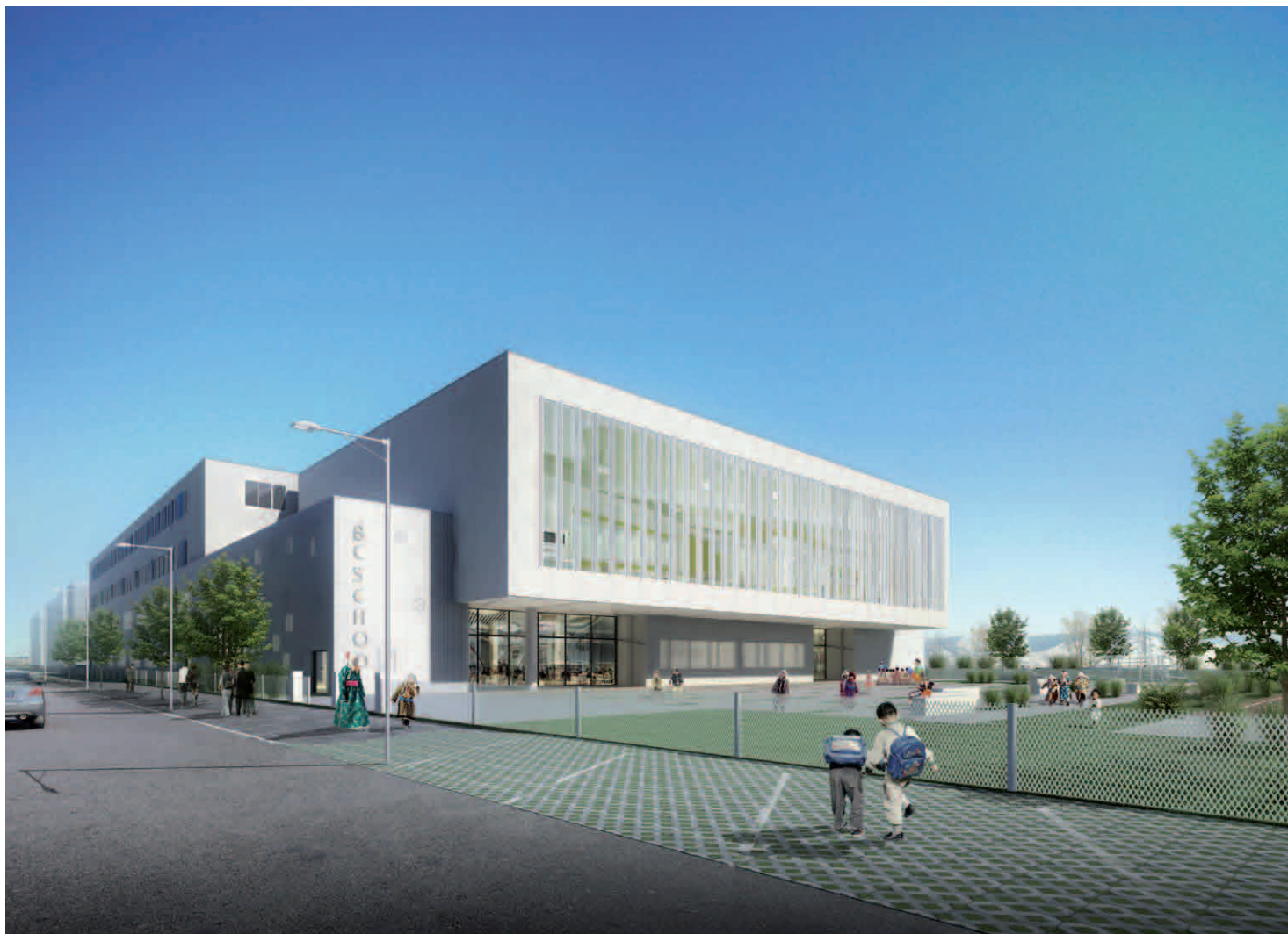
学校主入口效果图