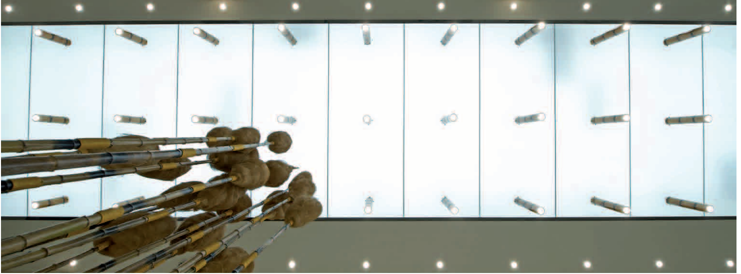
Light ceiling with illuminated bamboo sticks